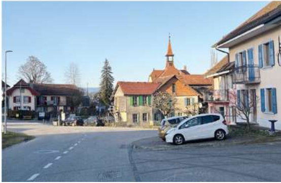
Le centre du village (1910-2026)