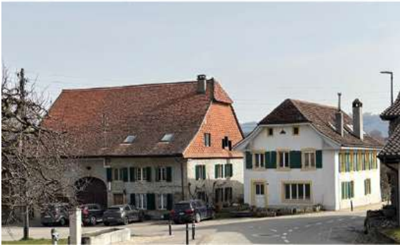
Ancien collège Oppens (1905-2026)