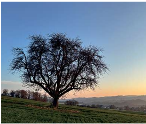
Un vénérable poirier domine la commune