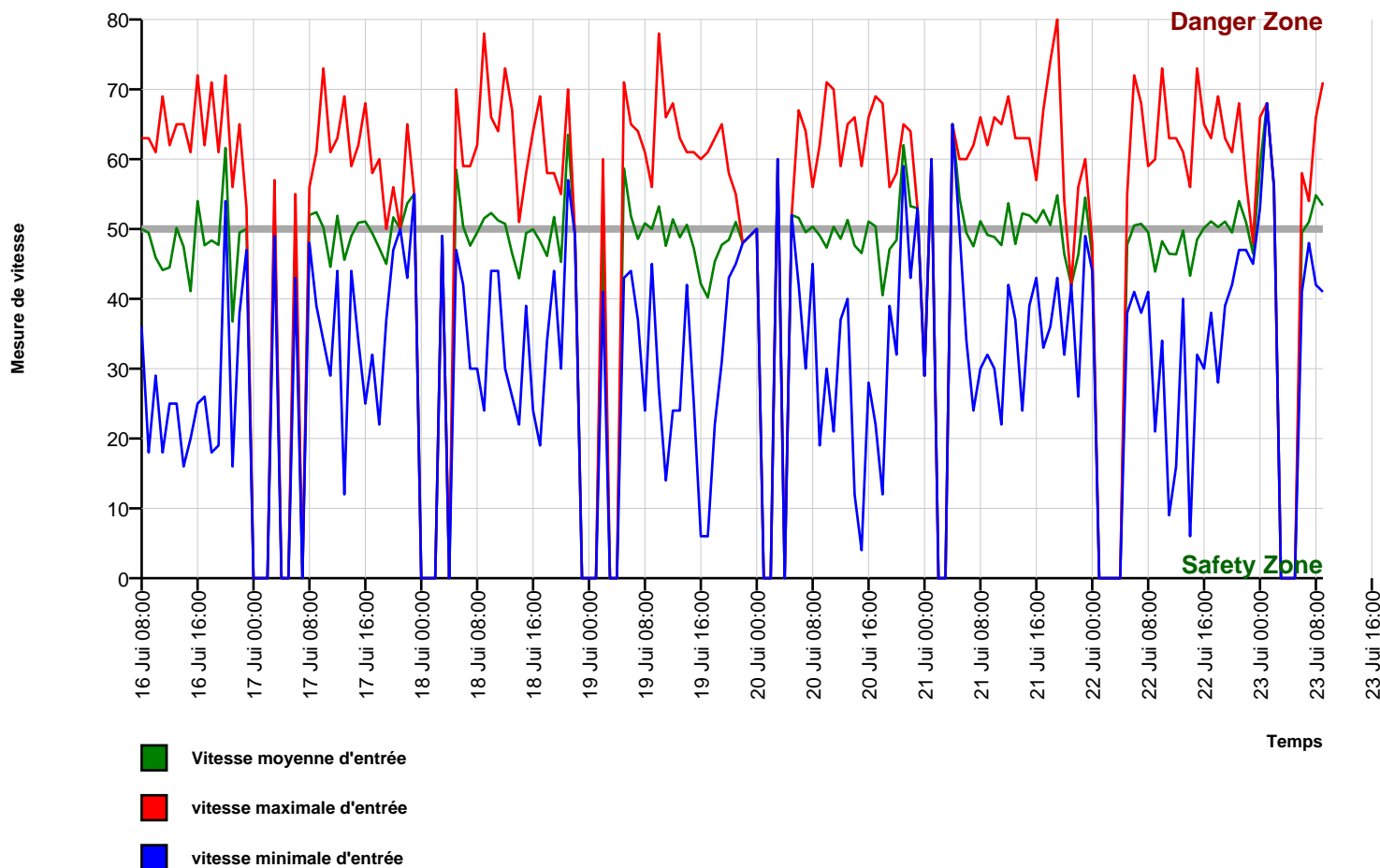
Diagramme de vitesse